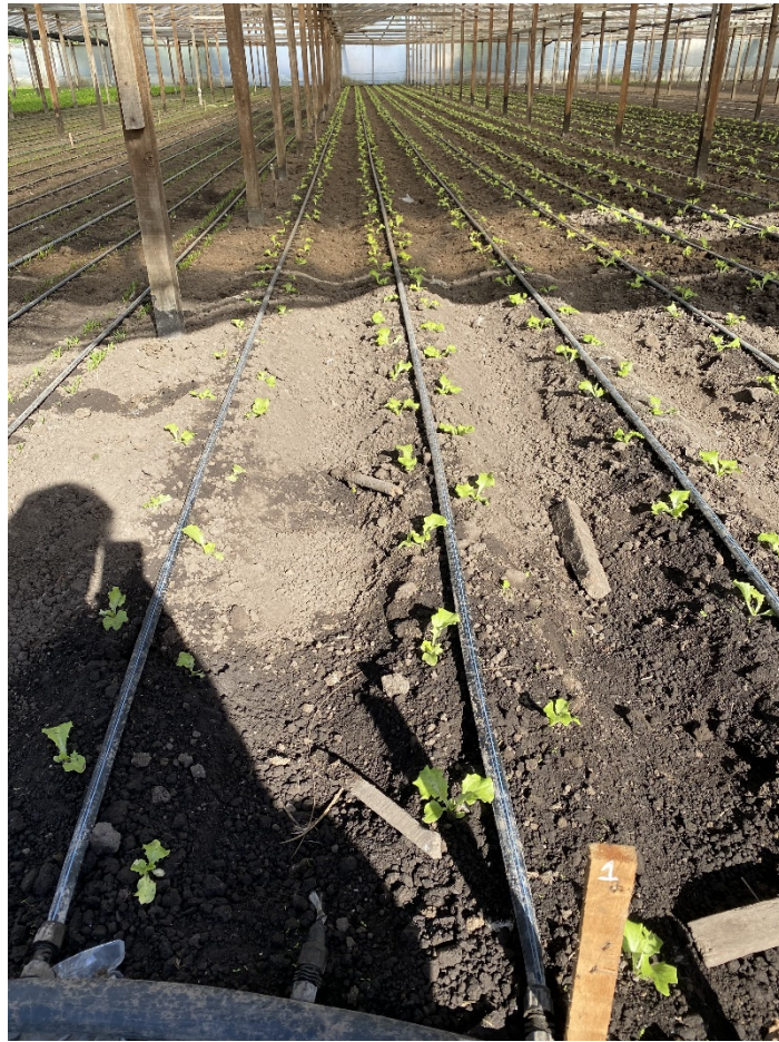
Fotografía 3. Estado del cultivo a los 30 días después de trasplante.